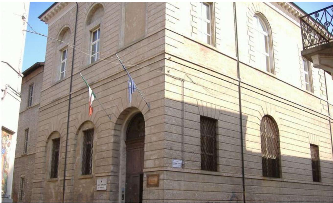
La scuola di Lorenzo (Faenza, Liceo Torricelli)